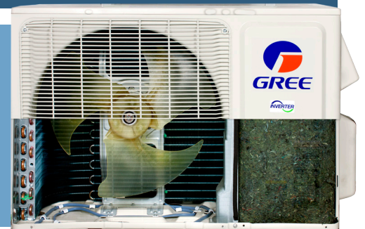
base avec élément chauffant

GREE équipe l'unité extérieure de la LOMO 23 d'une base avec élément chauffant qui empêche le gel de condensat et assure la pleine efficacité de l'appareil et une puissance de chauffage maximale.