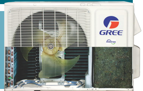
base avec élément chauffant

GREE équipe l'unité extérieure de l'Extreme d'une base avec élément chauffant qui empêche le gel de condensat et assure la pleine efficacité de l'appareil et une puissance de chauffage maximale.